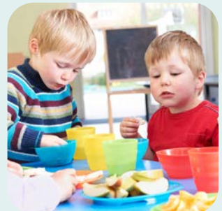
Küche & Lebensmittel