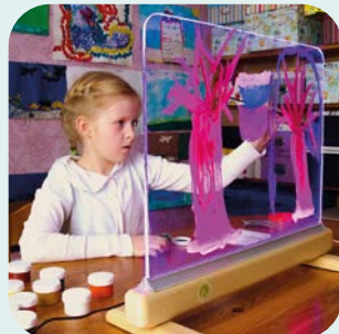
Spaß & Spiel