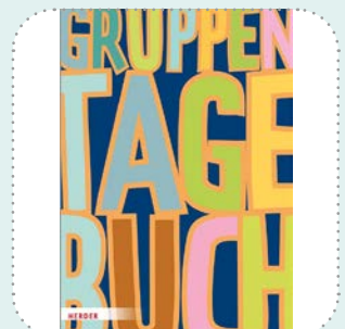
Bücher & Medien