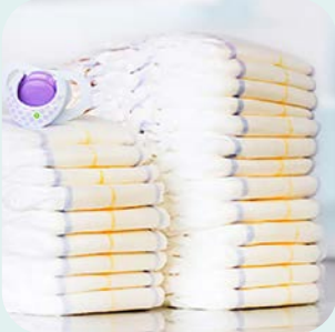
Windeln & Wickeln