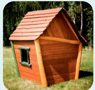
Garten & Außenbereich